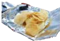
お菓子やラーメンの袋

迷ったら、♻️マークを目印に分別しましょう。汚れや中身は取り除いてから出してください。