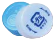
ペットボトルのキャップ