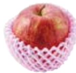
果物や野菜のネット