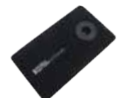
モバイルバッテリー