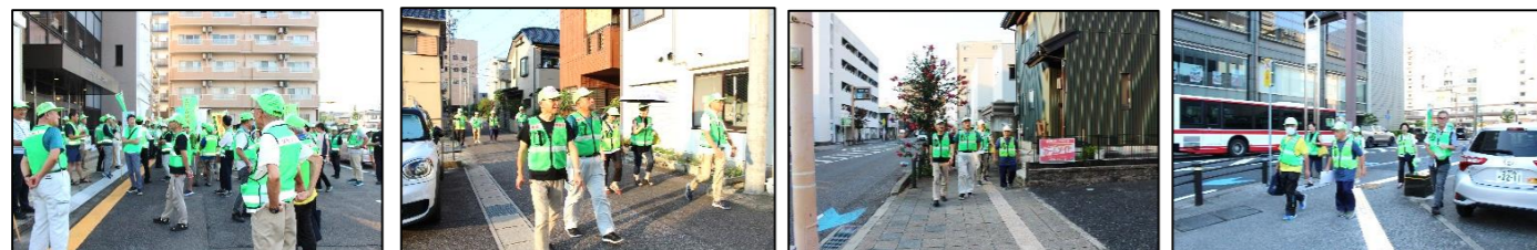
…「車だけ? 交通ルールは皆のもの」((令和6年交通安全スローガン))…