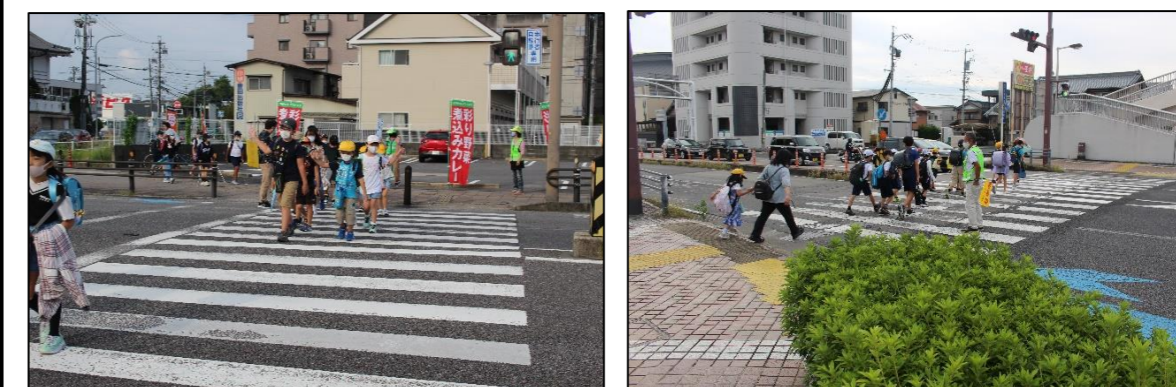
…「今日もまた あなたの無事故 待つ家族」(令和6年交通安全スローガン)…